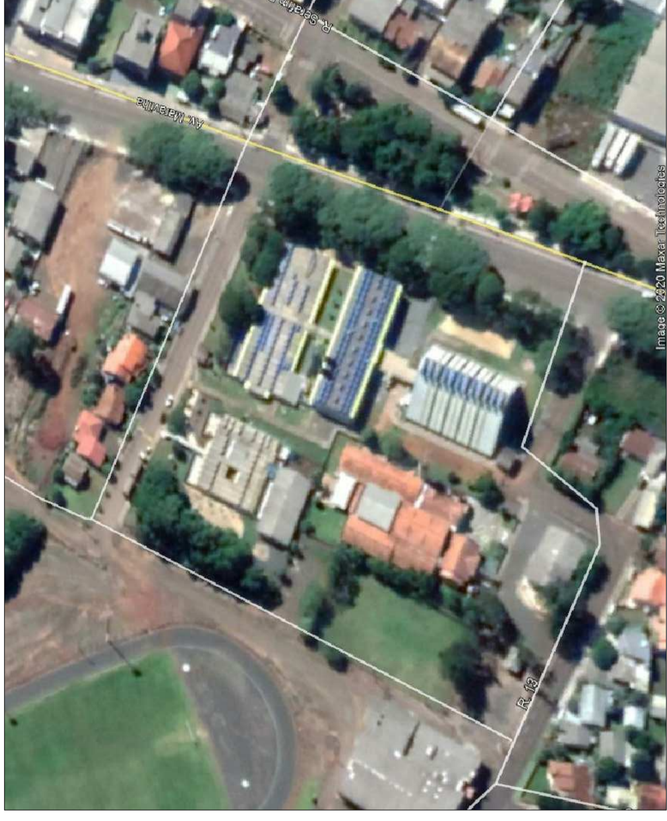
Imagem © 2020 Maxar | Technologies